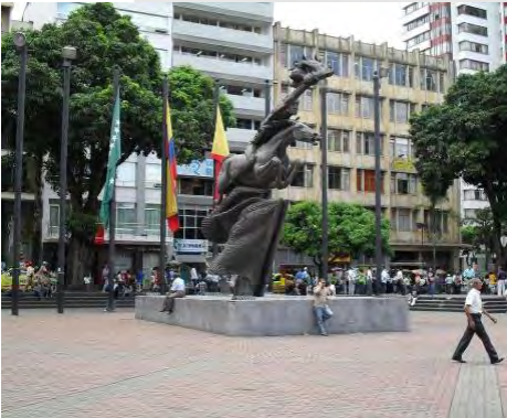
Plaza de Bolívar