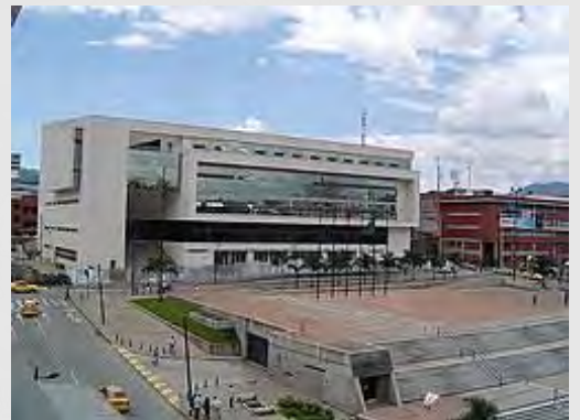
Plaza cívica Ciudad Victoria