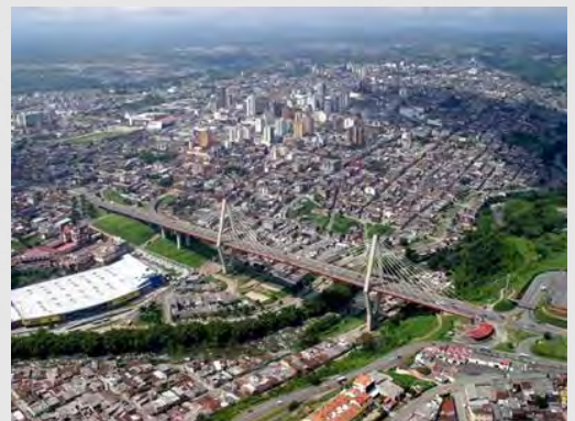
Panorámica ciudad de Pereira