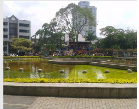
Parque Rafael Uribe Uribe - El Lago