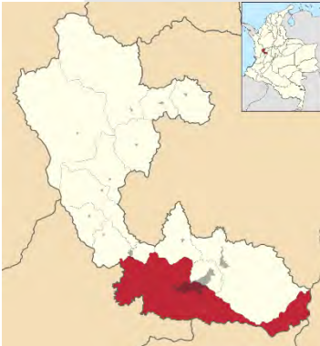
Ubicación geográfica, Pereira - Risaralda

Es llamada la “ciudad sin puertas” por la amabilidad y acogida con la que los pereiranos reciben a sus visitantes, territorio de hombres y mujeres pujantes que han convertido en una ciudad cívica y emprendedora. La pluriculturalidad de la población, sus fortalezas comerciales, sus áreas naturales y de patrimonio cultural hace uno de los mejores destinos del Paisaje Cultural Cafetero, lo que le confiere un especial atractivo para sus visitantes.